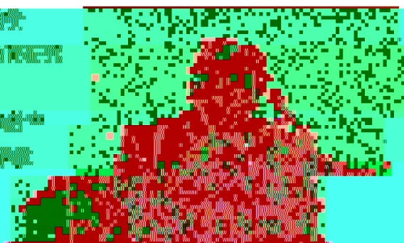
李國華教授與李國華教授合影